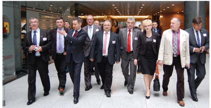
Wizyta przedstawicieli samorządu z województwa pomorskiego w Brukseli.

Jednocześnie interesuje mnie szukanie rozwiązań i dlatego spotykam się z różnymi środowiskami (społecznymi, samorządowymi, biznesowymi) w celu rozmowy o problemach i znalezienia form pomocy oraz wychodzenia z trudnych sytuacji.