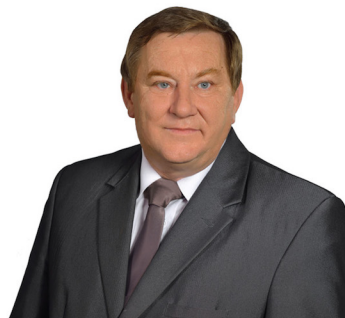
Kazimierz Chyła str. 4-5

Kandydat do Rady Powiatu Starogardzkiego