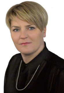
Anita Galant str. 6-7

Kandydat do Rady Powiatu Starogardzkiego