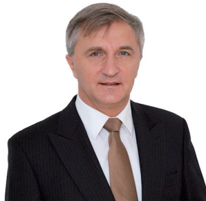
Bogdan Badziong str. 8-9

Kandydat na Wójta Gminy Smętowo Graniczne