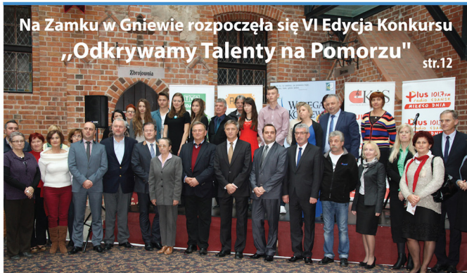
Na Zamku w Gniewie rozpoczęła się VI Edycja Konkursu „Odkrywamy Talenty na Pomorzu” str.12